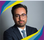
Mounir Mahjoubi Secrétaire d'Etat chargé du Numérique 20h45 | DemoZone

Le MDF ou Concours du Meilleur Développeur de France célèbre sa sixième édition à l'Espace Grande Arche où plus de 10 000 visiteurs sont attendus pour ce rendez-vous tech devenu incontournable. Les équipes d'Ametix et de Docapost (Groupe La Poste) ont travaillé durant près de 6 mois pour offrir au plus grand nombre un événement riche et fédérateur au sein de l'écosystème du numérique Français.