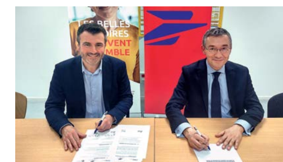
L'École de la 2 e chance de l'Artois Hauts-de-France, ce sont deux sites, à Liévin et Arras, regroupant 250 jeunes au total. Cette année, 80 élèves bénéficieront du financement de l'examen.

leur permis de conduire, étape cruciale vers leur autonomie, leur mobilité et leur accès à l'emploi. En s'associant avec l'E2C Artois Hauts-de-France, La Poste réaffirme sa politique d'engagement sociétal, et son rôle en tant qu'acteur clé du développement durable des communautés locales. Les élèves de l'E2C auront ainsi accès à des ressources éducatives de qualité, tout en bénéficiant du soutien de professionnels de La Poste pour les guider tout au long de leur parcours.