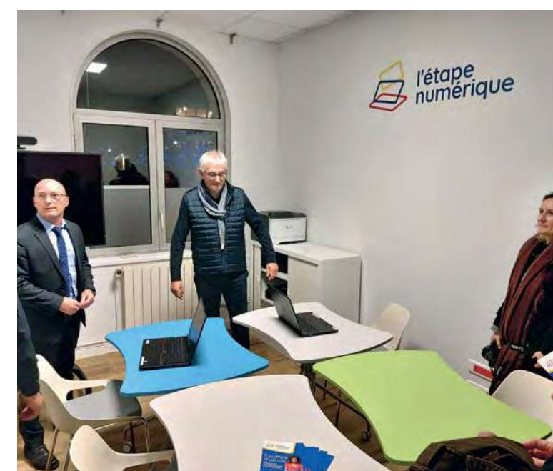
Formations à Arc-lès-Gray.

revitaliser le bureau de poste et pour la population d'Arc-lès-Gray d'avoir une Étape Numérique à disposition. Elle va permettre à des experts de dispenser des formations sans problématique de lieu ou de matériel. La Poste met tout à disposition et la réservation de la salle se fait simplement par une application. L'équipe municipale a pleinement conscience de la fracture numérique. Nous espérons que les associations d'Arc-lès-Gray vont aussi s'approprier l'espace numérique de La Poste, afin que les Arcois aient la possibilité de se former au numérique. »