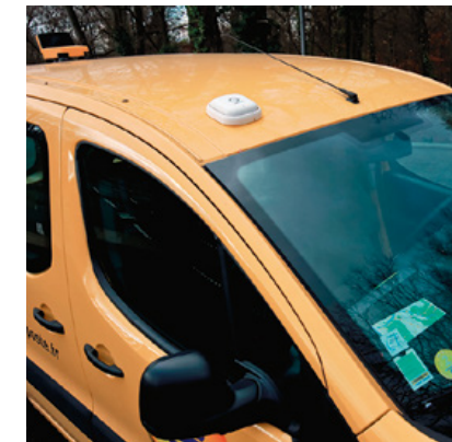
1 000 MICRO-CAPTEURS DE MESURE DE LA QUALITÉ DE L'AIR EN FRANCE GRÂCE À GEOPTIS.

* Sur un panel de 277 banques évaluées (source : ISS-ESG, 2020).