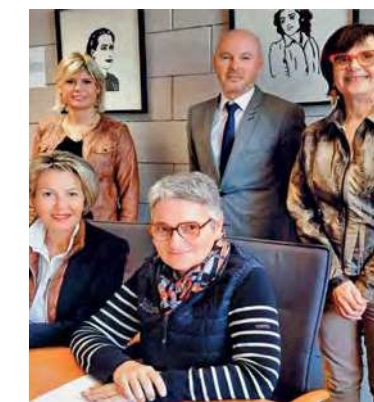
Signature de la convention avec La Poste.

Pour répondre à un triple objectif de rapidité de diffusion, de simplification et de sécurisation des envois postaux, la prestation a été confiée à La Poste. Pendant un mois, en fin d'année, les 3 800 foyers qui ont commandé des chèques-cadeaux ont bénéficié d'une remise en main propre accompagnée d'un commentaire à leur attention par le facteur. Morlaix Communauté a mobilisé cette année une enveloppe de 150 000 euros pour doubler la mise du consommateur avec des chèques-cadeaux valables jusqu'au 31 mai 2023.