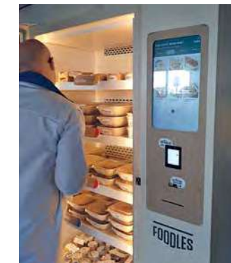
Livraison de repas dans un frigo connecté.