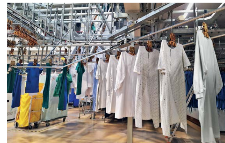
La durée de vie d'un vêtement professionnel au CHU est de 80 à 120 lavages.

De 400 kg à 500 kg de textiles du CHU Dijon Bourgogne recyclés mensuellement par Recygo.