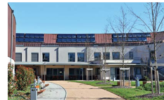
Une dizaine d'Ehpad publics sollicitent déjà l'accompagnement de La Banque Postale.