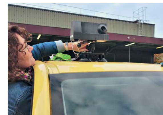
La caméra, embarquée sur le véhicule La Poste, collecte les images du réseau routier. Les données sont ensuite transmises à Geoptis pour analyse.

(1) Filiale du groupe La Poste spécialisée en géomarketing et en géointelligence.