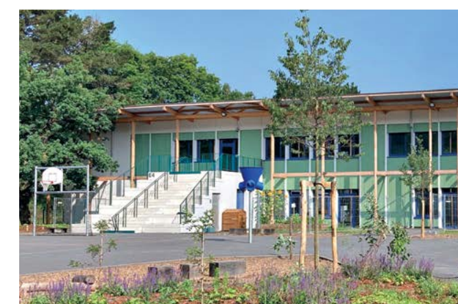
Le groupe scolaire Georges-Leygues financé par un prêt vert (réalisé en 2023).