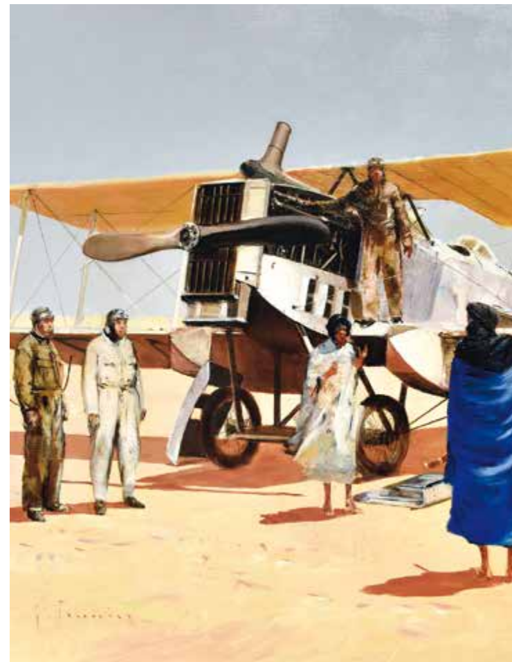
« Le drame du 11 novembre 1926 » du peintre et illustrateur J. Prunier, 2017 Musée de La Poste.