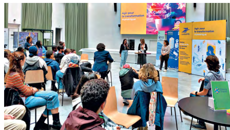
Les Cafés IA organisés à la Maison de l'innovation à Nantes, le 24 septembre dernier.

POUR EN SAVOIR PLUS SCANNEZ LE QR CODE CI-CONTRE