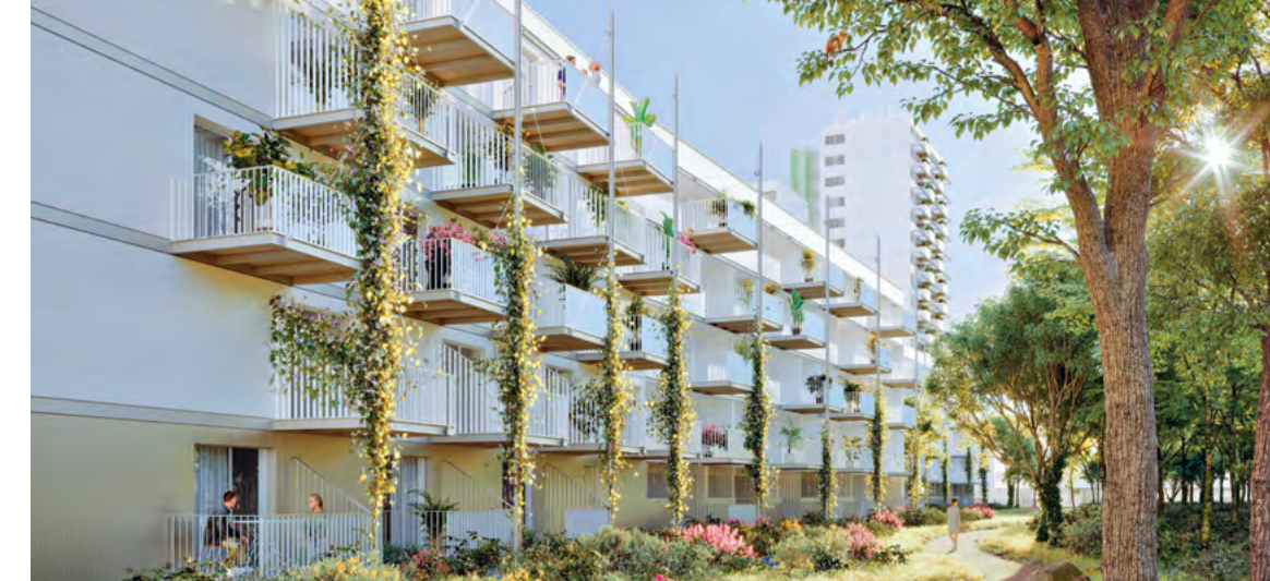
Projection de la résidence Le champ de courses après la réhabilitation.