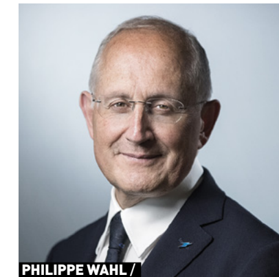
PHILIPPE WAHL / PDG du Groupe La Poste

“C'est une belle aventure à laquelle nous sommes fiers de pouvoir contribuer et participer, d'autant plus qu'en Europe et dans le monde, pour de la location de vélos en longue durée, il n'y a actuellement pas d'équivalent !”