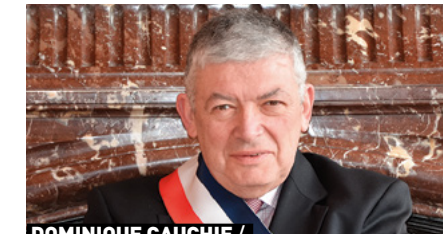
DOMINIQUE CAUCHIE / Maire de Liverdy-en-Brie