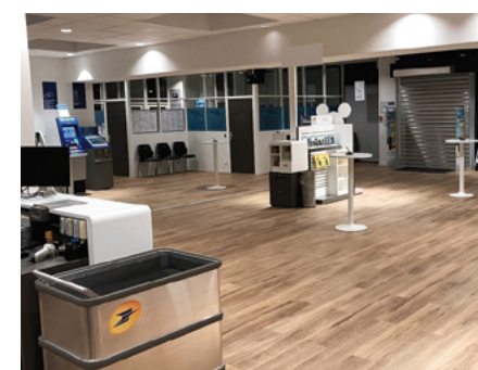
LE BUREAU DE POSTE D'ÉVRY

« Le point de services La Poste relais dans la commune de Malakoff, limitrophe de Montrouge, a ouvert le 17 mai 2018, au sein du Monoprix de l'avenue Pierre-Brossolette, pour répondre à l'afflux des colis. Il est situé dans un quartier d'entreprises, de l'autre côté de la Porte d'Orléans. Il est proche des transports en commun et de l'itinéraire quotidien d'un maximum de clients et doté d'un parking. Y acheter ses timbres tout en faisant ses courses, acheter un cadeau tout en l'envoyant par Chronopost, tout cela, Monoprix le propose pour simplifier la vie des consommateurs. Les horaires d'ouverture sont très larges : de 9 h à 21 h du lundi au samedi. »