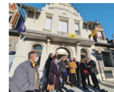
Inauguration du bureau de poste de Montmartin-sur-Mer, labellisé France Services le 23 novembre dernier, en présence de nombreux élus.

succès l'audit qui valide le respect des 30 critères obligatoires définis par les pouvoirs publics, et ainsi décrocher en janvier la labellisation France Services. Après les bureaux de poste de Bréhal et Montmartin-sur-Mer, labellisés en octobre 2021, celui de Saint-Sauveur-Villages est le troisième du département à accueillir dans ses locaux un espace France Services et le quinzième de la région Normandie.