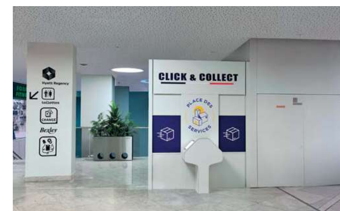
Maquette d'un projet de point de click and collect Colidrop.