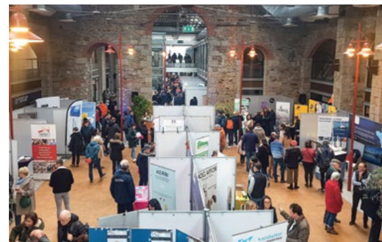
Le salon Grand Ouest Innovations.

développement des services numériques à impact positif pour la société, ainsi que les offres en matière d'accompagnement bancaire à destination des professionnels. Ce salon a été l'opportunité de rencontrer des jeunes innovateurs investis pour un numérique à impact positif, responsable, durable et inclusif. Cet événement fut également l'occasion pour La Poste de valoriser les solutions numériques utiles au quotidien telles que la tablette connectée Ardoiz, dédiée aux personnes éloignées des pratiques digitales, ainsi que L'Identité Numérique La Poste.