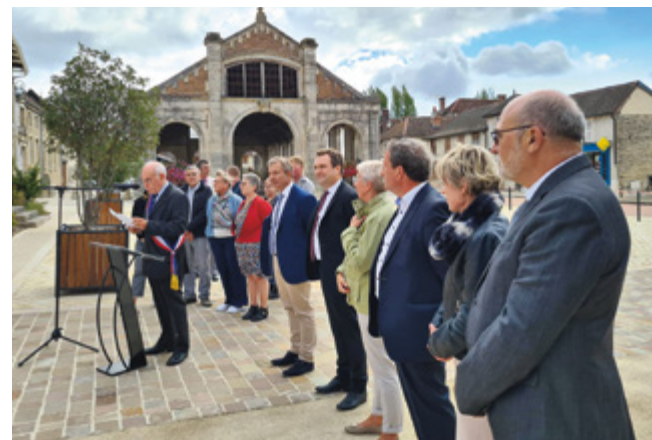
Inauguration de l'agence postale à Dienville au mois de septembre dernier.

communales, qui permettent d'accéder aux services essentiels bancaires et postaux. Son réseau de consignes Pickup va également se développer à l'horizon 2023 avec des consignes réparties sur tout le territoire français, permettant de retirer de façon autonome et rapide ses colis. Des usages devenus incontournables et particulièrement appréciés des particuliers. Enfin, pour offrir toujours plus de proximité au cœur des territoires, elle développe la présence de facteurs-guichetiers, une nouvelle forme de présence postale dans les territoires ruraux à faible densité. Le facteur-guichetier partage sa journée entre la distribution des colis et courriers et l'accueil des clients au sein du bureau de poste de la commune. Plus de 80 facteurs-guichetiers sont en place dans le Grand Est.