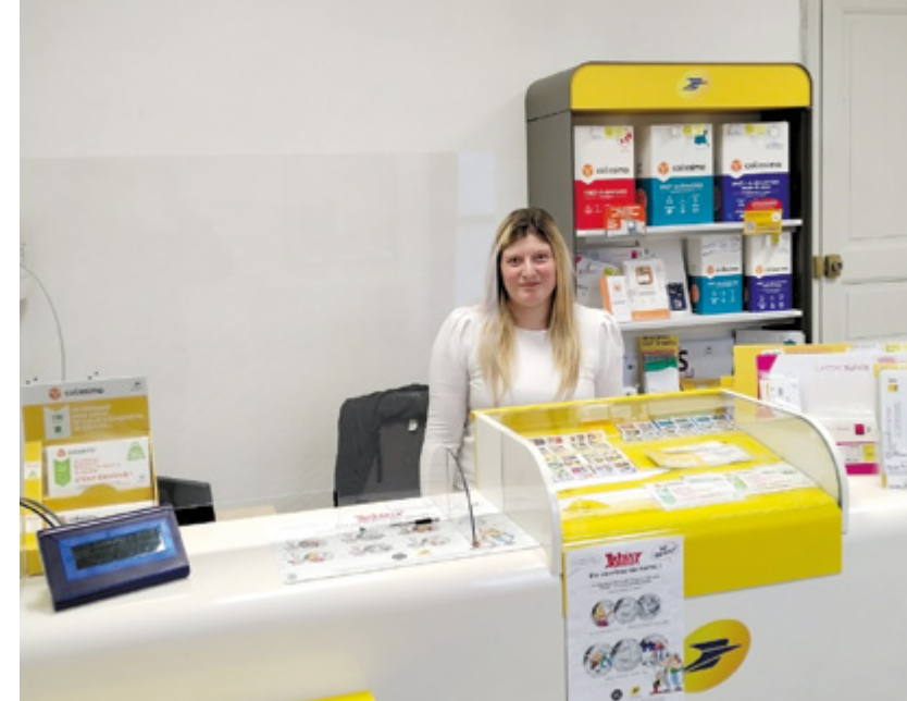
À Étoges, l'accueil est assuré dans des locaux modernisés.