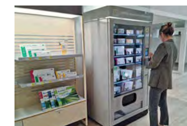
Avec l'automate DistriPoste présent dans l'espace d'accueil du bureau de poste de Rouen Jeanne d'Arc, les clients peuvent acheter des enveloppes, des emballages ou des timbres.

(particulier et professionnel) et le conseil bancaire. Entre autres équipements : une borne digitale, une gondole La Poste Mobile et des automates dernier cri, telle une consigne Duo pour déposer ou retirer un colis. Le bureau est aussi pourvu d'une pièce pour le passage du Code de la route et du permis bateau et d'une salle de formation au numérique. À ces sites pionniers succédera une seconde vague avec 80 bureaux supplémentaires à l'horizon de 2024.