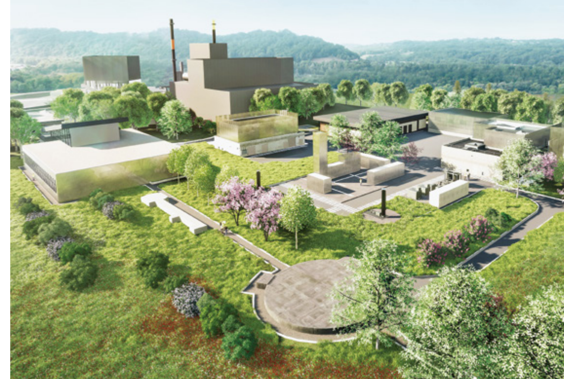
Vue d'ensemble des futures unités de méthanisation et de méthanation de l'usine de traitement des eaux usées de Lescar.

Les engagements pris dans le cadre de la convention pour le développement d'une logistique urbaine durable et à faibles émissions s'articulent autour de sept leviers : proposer aux commerçants, artisans, habitants et organismes publics situés en centre-ville un maillage de points de mutualisation permettant d'optimiser les modalités de transport de marchandises en ville ; réussir la livraison au premier passage grâce à un maillage de solutions de livraison hors domicile ; valoriser le foncier et l'immobilier à destination d'activités logistiques ; développer la cyclologistique ; favoriser l'utilisation de véhicules à zéro ou à faibles émissions ; contribuer à une meilleure visibilité des questions de logistique urbaine dans les politiques publiques ; développer des échanges d'expertise réguliers.